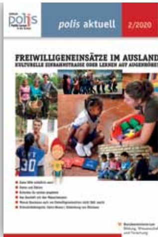
FREIWILLIGENEINSÄTZE IM AUSLAND polis aktuell 2/2020

> www.politik-lernen.at/pa_kriseundungleichheit