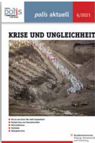
KRISE UND UNGLEICHHEIT polis aktuell 6/2021

> www.politik-lernen.at/pa_kriseundungleichheit