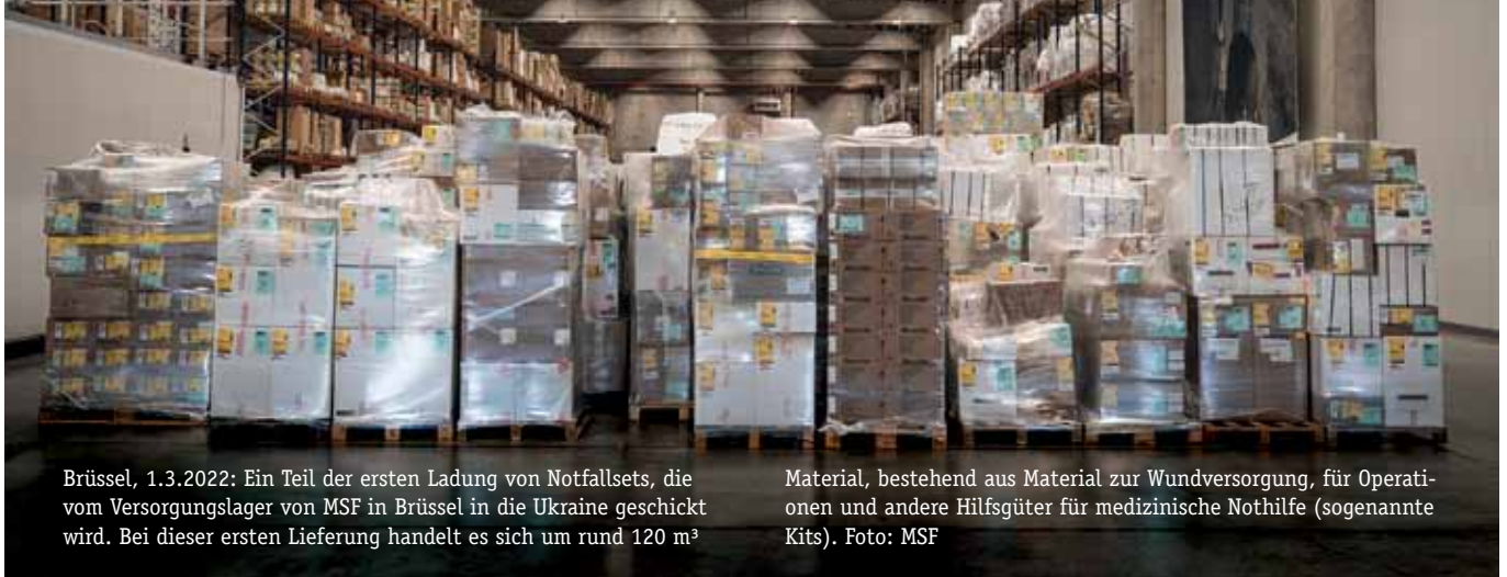
Brüssel, 1.3.2022: Ein Teil der ersten Ladung von Notfallsets, die vom Versorgungslager von MSF in Brüssel in die Ukraine geschickt wird. Bei dieser ersten Lieferung handelt es sich um rund 120 m 3