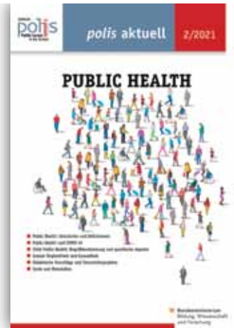
PUBLIC HEALTH polis aktuell 3/2021

> www.politik-lernen.at/pa_freiwilligeneinsaetze