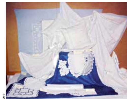
Handarbeitsgruppe Roppen: 24.000 Euro Reinerlös an Ärzte ohne Grenzen .