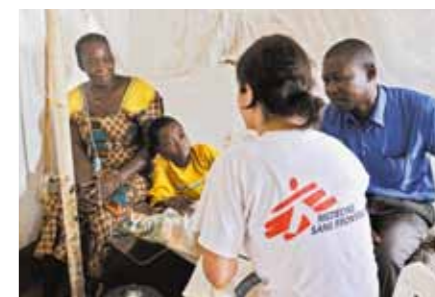
Einsatz in der Grenzregion Abyei: medizinische Grundversorgung und Ernährungshilfe.

Anlässlich des Referendums über die Unabhängigkeit des Südsudans im Jänner stand das Land Anfang des Jahres kurz im weltweiten Fokus. Der Südsudan befindet sich jedoch permanent in einer humanitären und medizinischen Ausnahmesituation: Über 75 Prozent der Bevölkerung haben keinen Zugang zu medizinischer Grundversorgung, und es herrscht chronische Mangelernährung. Regelmäßig brechen vermeidbare Krankheiten aus, Gewalt führt immer wieder zu Vertreibungen. Auch mit dem Beginn des Referendums haben Konflikte und gewaltsame Zusammenstöße vor allem nördlich der Grenzregion Abyei deutlich zugenommen. Die Unsicherheit im Südsudan ist jedoch allgegenwärtig: Im Jahr 2010 wurden, bedingt durch Gewalt zwischen verschiedenen Stämmen, Rebellengruppen wie der LRA (Lord's Resistance Army) und neuen Milizen, über 900 Tote und