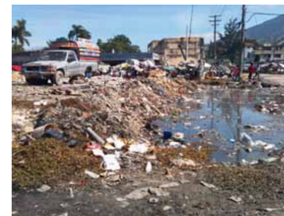
Risikofaktor Hygiene: Cholera breitet sich aus, wenn Trinkwasser verschmutzt ist.

Genauso wichtig wie die medizinische Erfahrung ist bei der Bekämpfung