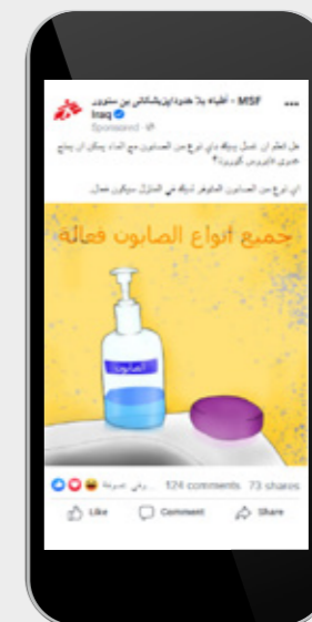
Gelungene Aufklärung: Gezielte Botschaften informieren die Menschen über richtiges Gesundheitsverhalten (Irak, 2020).

Digitale Gesundheitsaufklärung hat besonders durch die COVID-19-Pandemie eine erhöhte Aufmerksamkeit erlangt. Vor allem weil es vielerorts nicht möglich war, klassische Gesundheitsaufklärung durchzuführen, also etwa „von Tür zu Tür“ zu gehen oder aufgrund der Ausgangsbeschränkungen überhaupt das Büro zu verlassen. Der Stellenwert digitaler Maßnahmen ist dadurch gestiegen. Mit unseren Aktionen in zwölf Ländern haben wir innerhalb weniger Wochen 19 Millionen Menschen erreicht. Das ist beachtlich.