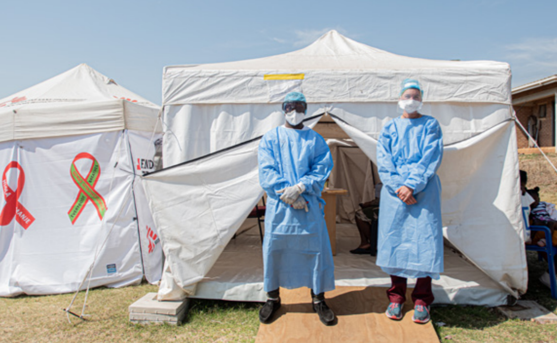
COVID-19: Ärzte ohne Grenzen unterstützt die lokalen Behörden bei Testungen (Südafrika, August 2020).

So wurden etwa in Paris vor allem Bevölkerungsgruppen, die kaum Zugang zu medizinischer Versorgung haben, wie Obdachlose oder Asylwerberinnen und Asylwerber und Geflüchtete, mit Präventionsmaßnahmen angesprochen. Denn im Fall einer Epidemie – oder Pandemie wie COVID-19 – ist gerade Gesundheitsaufklärung wesentlich, um die Krankheit einzudämmen. Ärzte ohne Grenzen hat hier große Erfahrung in unterschiedlichsten Bereichen und Ländern wie zum Beispiel Pakistan.