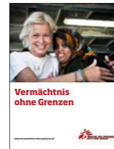
Vermächtnis ohne Grenzen