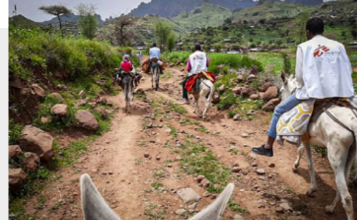
Entlegene Gebiete: Manchmal erreichen die Teams ihre Patientinnen und Patienten nur auf dem Rücken von Eseln (Sudan, September 2020).