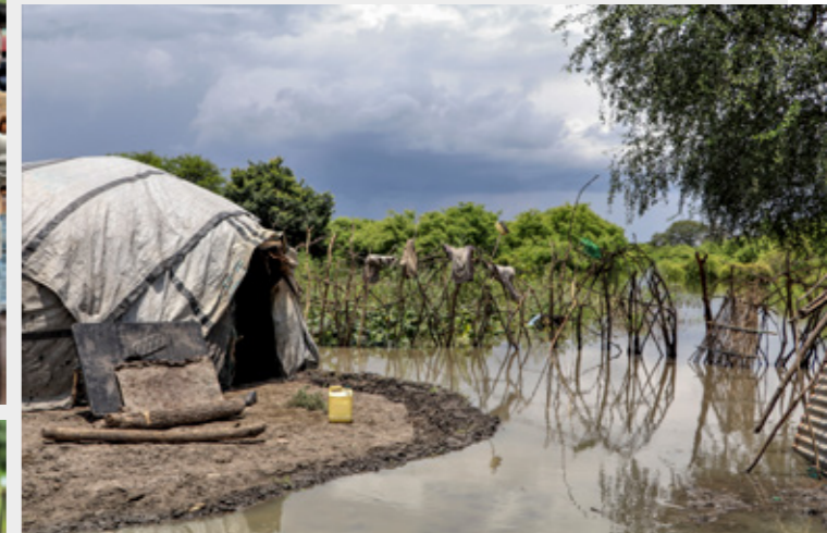
Für die Teams von Ärzte ohne Grenzen bedeutet das ein Überwinden zusätzlicher Hürden – aber um die Patientinnen und Patienten zu erreichen, wird hart daran gearbeitet: zum Beispiel mit einer mobilen Klinik in Lukuronyang (alle Fotos: Südsudan, September 2020).