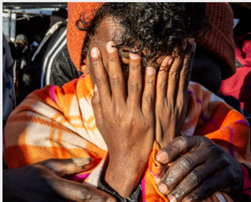
Traumatische Erfahrungen: Flüchtlinge, Migrantinnen und Migranten leben in Libyen in ständiger Gefahr und sind massiver Gewalt ausgesetzt (Mittelmeer, Februar 2020).

1 Mittelmeer: „Taten sagen mehr als leere Worte. Sofern die EU ihre Unterstützung für die libysche Küstenwache nicht einstellt, ist jede Rede von der Rettung von Menschenleben und einem humanen Ansatz nur scheinheilige Rhetorik.“