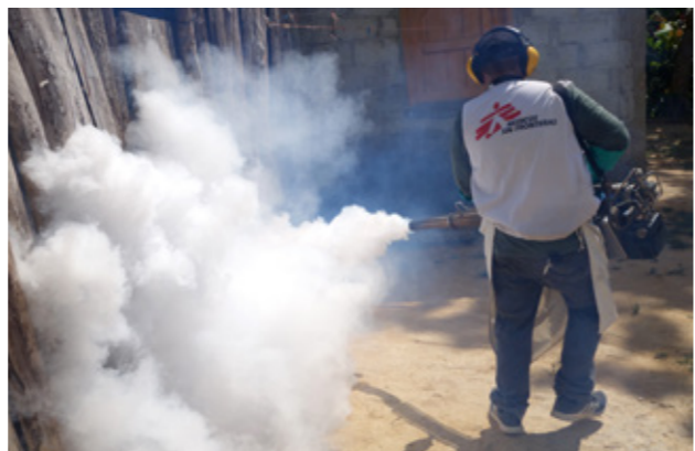
Denguefieber: Einsatz von Sprühmitteln gegen Moskitos als Überträger der Krankheit (Honduras, März 2019).

nach Lobbyarbeit durch Ärzte ohne Grenzen haben die lokalen Gesundheitsbehörden diese wieder geöffnet.