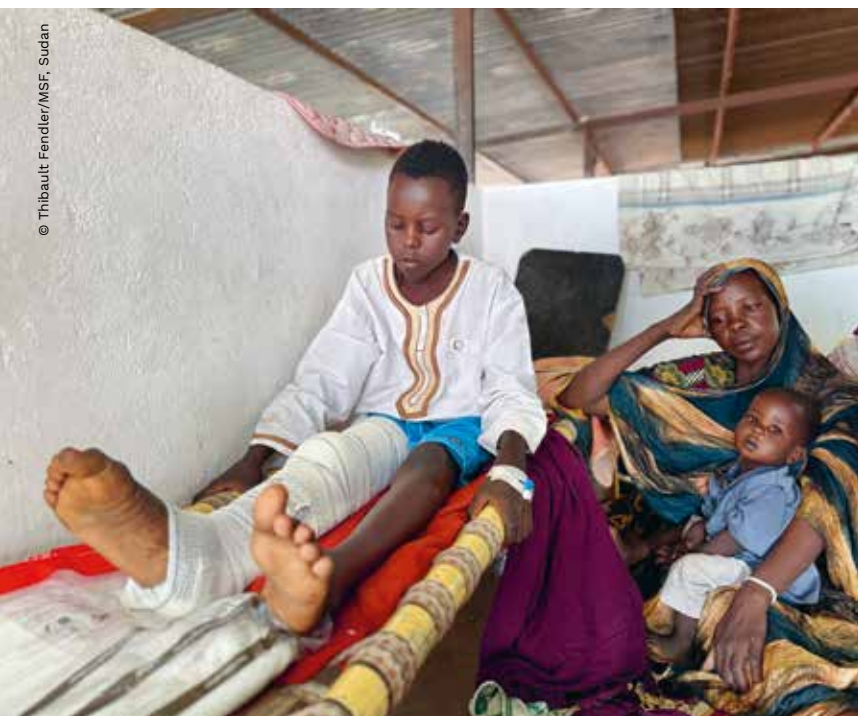
SUDAN Adil hat eine Schussverletzung, wir versorgen ihn sofort.

Unsere Hilfe im Sudan wurde mit 1.500.000 Euro aus Österreich unterstützt.