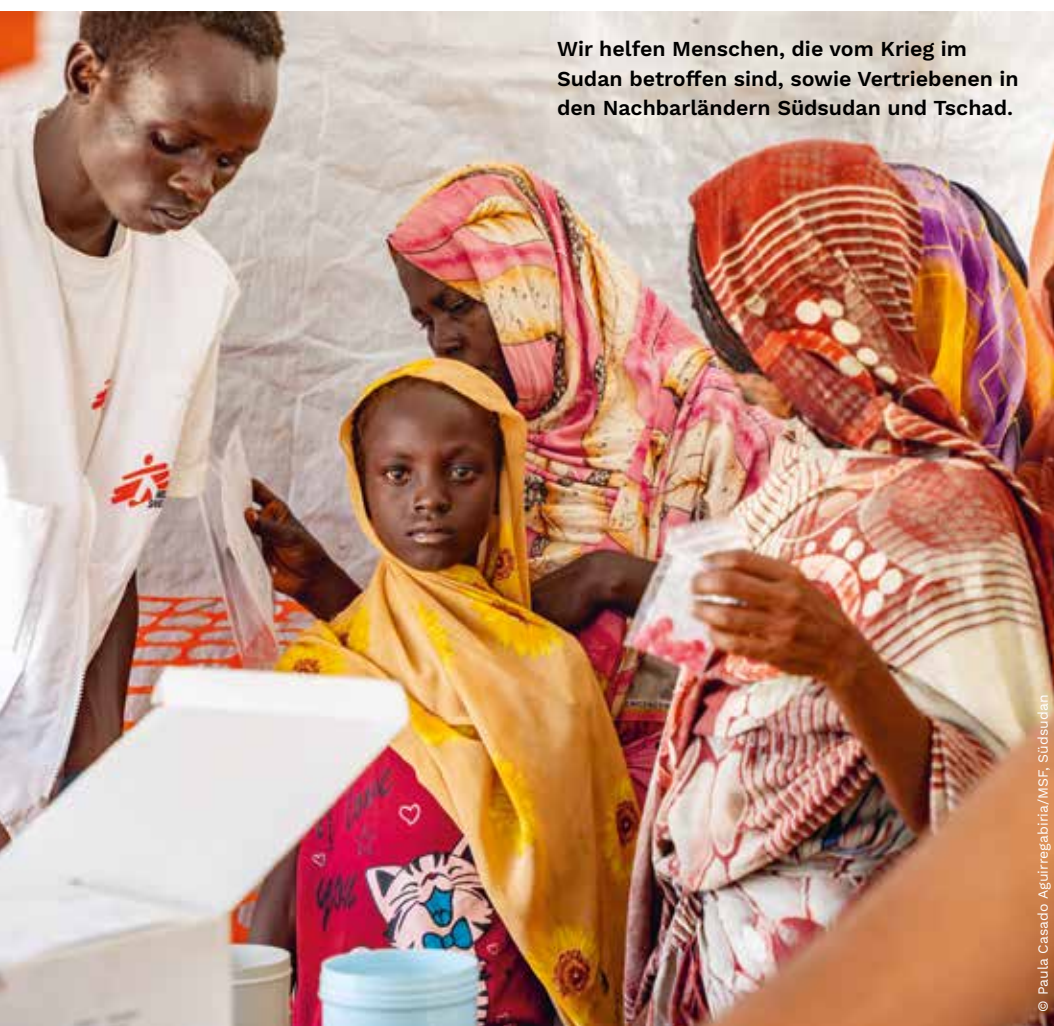
Wir helfen Menschen, die vom Krieg im Sudan betroffen sind, sowie Vertriebenen in den Nachbarländern Südsudan und Tschad.

Mehr als 165.000 Menschen in Österreich haben im Jahr 2025 gemeinsam über 33,7 Millionen Euro gespendet. Dank dieser Unterstützung konnten wir weltweit dort medizinische Hilfe leisten, wo Menschen uns am dringendsten gebraucht haben. Dafür danken wir von Herzen!